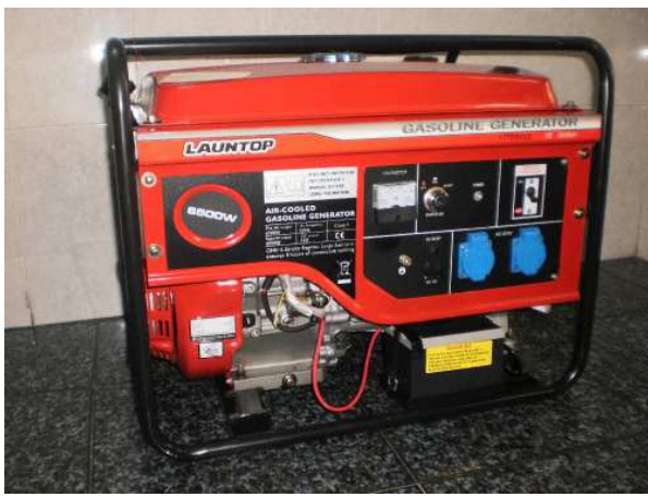
Máy phát điện xăng Model : Giật và đề