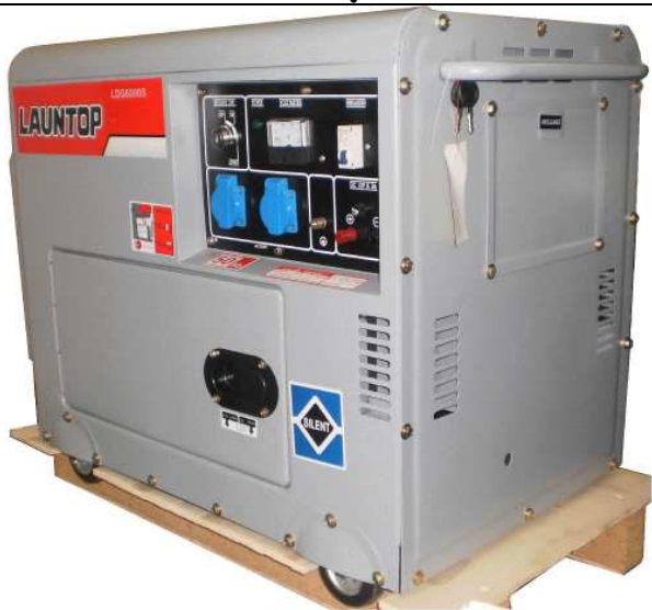
Máy phát điện Diesel Model : Đề nổ