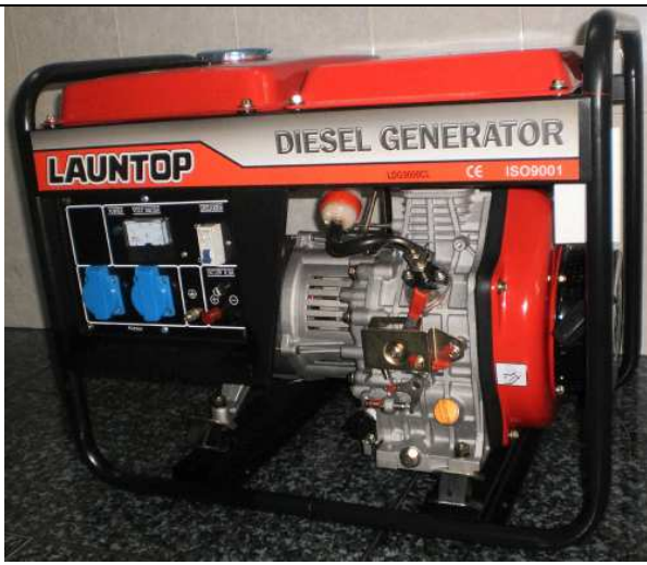
Máy phát điện Diesel Model : Giật nổ