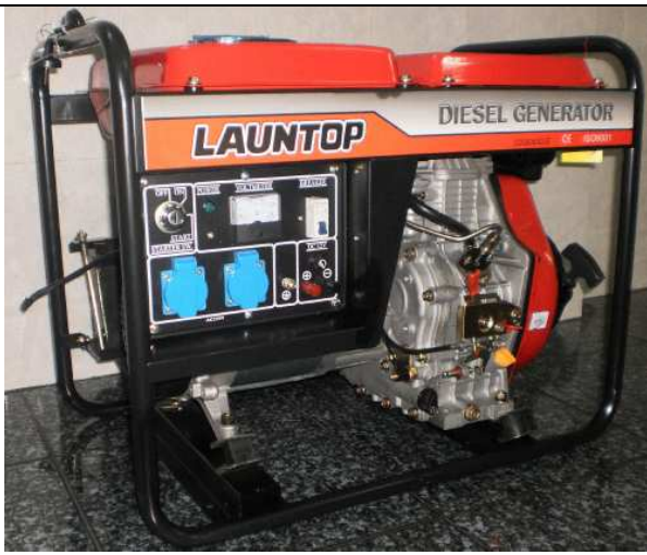
Máy phát điện Diesel Model : Giật và đề