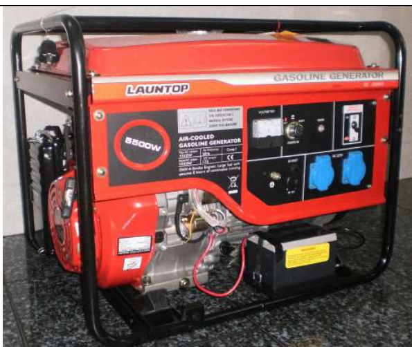
Máy phát điện xăng Model : Giật và đề