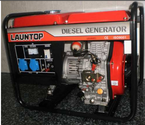
Máy phát điện Diesel Model : Giật và đề