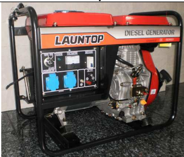
Máy phát điện Diesel Model : Giật nổ